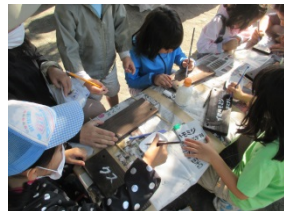
釜利谷柿ノ木公園