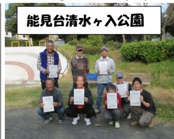
能見台清水ヶ入公園